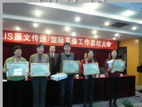
我校图书馆荣获 2009 年度 BALIS 馆互