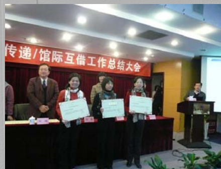
我校图书馆荣获 2009 年度 BALIS 原文传递优质服务馆一等奖