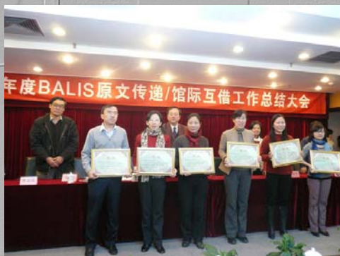
我校图书馆荣获 2009 年度 BALIS 馆际